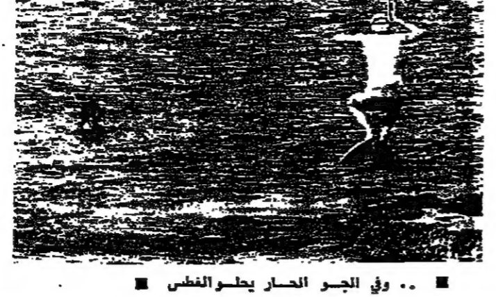
وفي الجو الحار يطاول الغنم